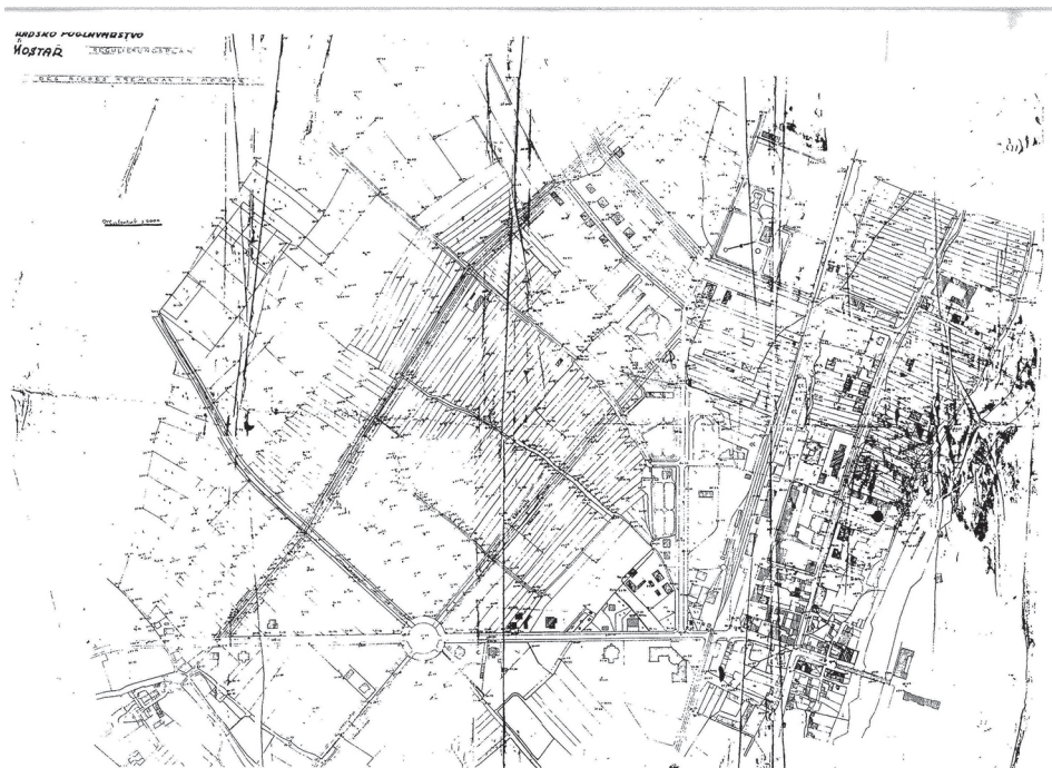
Slika 2. Regulacijski plan Rondoa iz 1894. godine