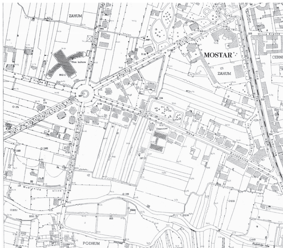
Slika 3. Karta Rondoa iz 1954., kakva je bila do 1995. godine

Prije tridesetak godina na scenu stupaju ljudi koje bi se moglo nazvati građomrziteljima, 15 koji se ne prilagođavaju gradu i urbanomu načinu mišljenja i življenja, nego grad prilagođavaju sebi i svojoj (ne)kulturi i civilizacijskoj razini. U skladu sa svojim (ne)znanjem, a poglavito interesima donose i zakone i urbana pravila.